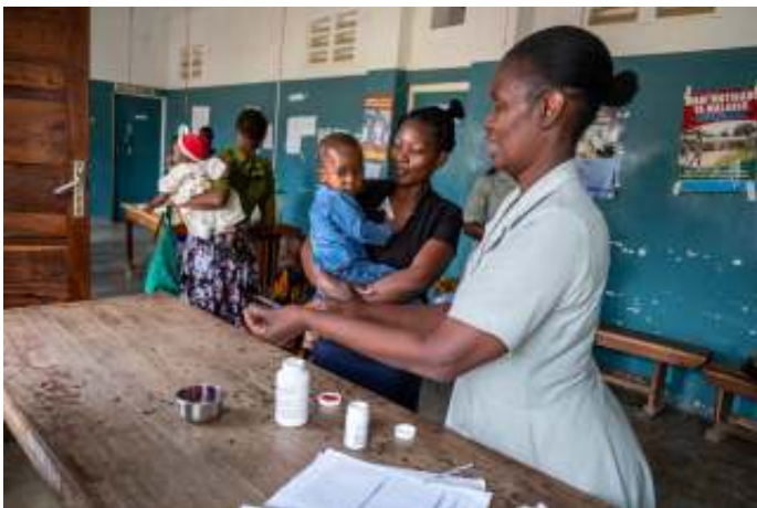
Zorg voor de kinderen en ziektepreventie