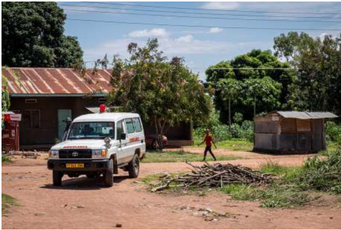
Ambulance: onmisbaar vervoer