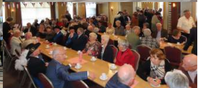
Fotografie: Lonneke Buijs, Rien van Aarle en privébezi