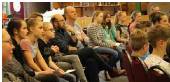
Abdijdag 7 april