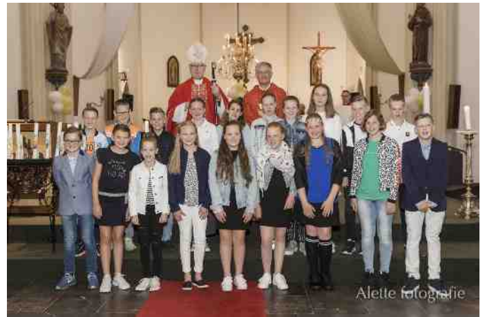
Vormelingen Heeswijk en Dinther