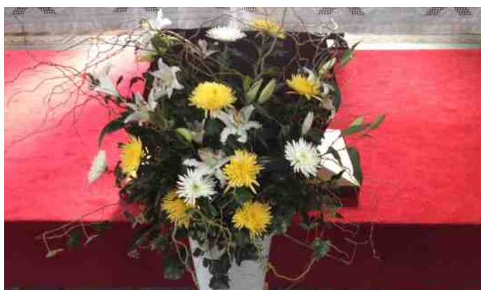
Een mooi paasstuk van de werkgroep bloemsieren

Na schooltijd gingen de kinderen met de vrijwilligers de zakjes brengen naar zieke mensen, naar mensen met beperkingen en naar de oudsten van onze geloofsge-meenschap.