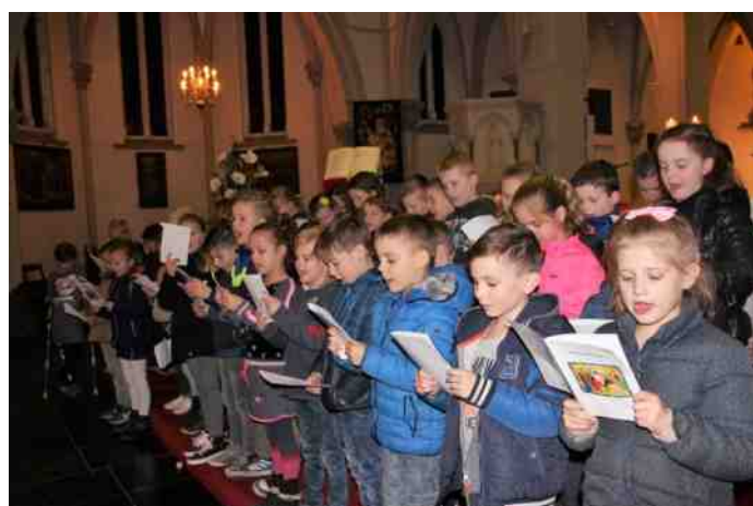
Palmpasenviering communicanten Heeswijk/Dinther/Loosbroek