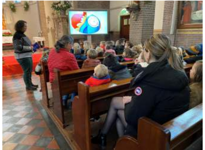
Basisschool bezoekt kerk

Rondom Kerstmis en Oud & Nieuw in onze parochie