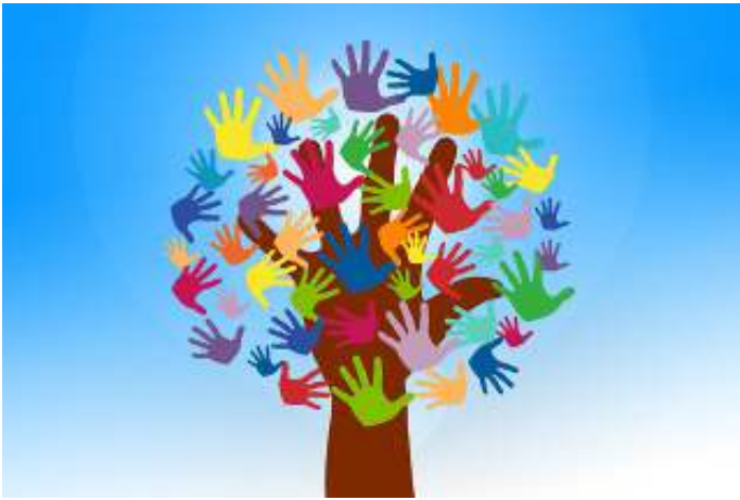
Vele handen --- Licht werk