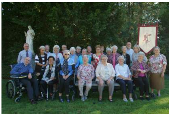
Levensvreugd bij 50-jarig bestaan

Het vijftigjarig bestaan van het ouderenkoor is nog groots gevierd met een korendag waaraan twaalf koren meededen.