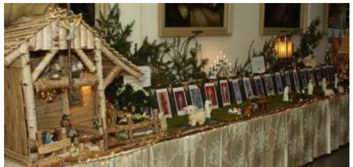
Kerststal in de pandgang 2020

ik ontmoet je dan gewoon heel kort voelt nog zo fijn zo vertrouwd alsof jij en ik nog wij zijn.