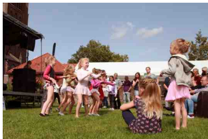
Spontaan een extraatje

In de Ontmoetingstuin achter onze St Servatiuskerk was het op zondag 20 augustus buitengewoon gezellig. Het was immers weer tijd voor het jaarlijkse tuinfeest. Jong en oud iedereen kwam er bij elkaar voor koffie, een drankje, verse koeken uit de oven, soep, pannenkoeken en een barbecue. Voor het springkussen, voor een nadere kennismaking met de tuin en voor het beklimmen van de kerktoren. Vooral echter voor Hadee's Got Talent, waarbij de jeugd optrad met zang, dans en muziek. De eerste prijs was voor de danseressen van de Heeswijkse Balletschool. De Kornuiten en dj Carl Verhoeven zorgden de rest van de middag voor het muzikaal vertier. Kortom een aanrader voor volgend jaar. Dank aan de vele vrijwilligers!