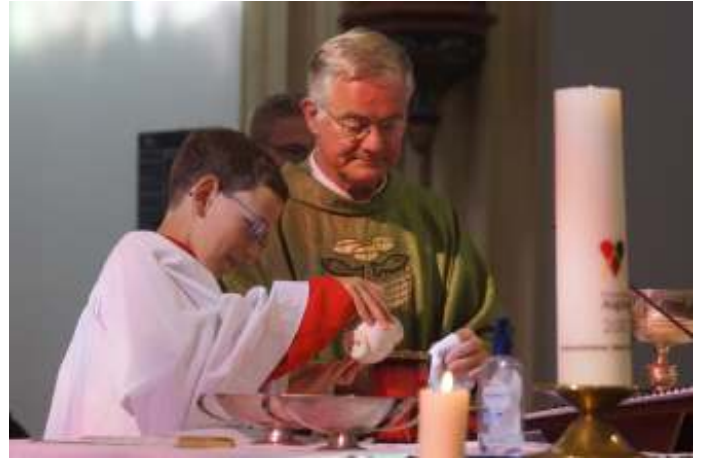
Impressie parochiedag zondag 24 september 2023